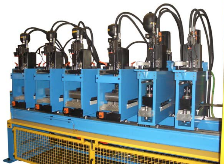
Exemple : 4 têtes 20t 2 têtes 8 x 20t avec Y numérisé